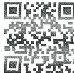
แบบกรอกประวัติ 2 แบบ