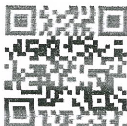
ข่าวประชาสัมพันธ์